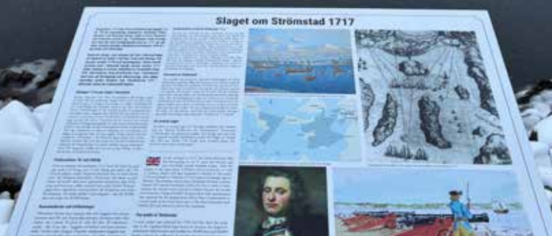
Den nyligen uppsatta skylten som berättar om sjöslaget 1717.

I räkenskaper från 1575 har jag funnit att det då fanns en lastplats för skogsprodukter vid Strömsåns mynning. Det är därifrån som Laholmen fått sitt namn, då ön är benämnd som lastholmen.