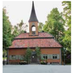
Sigtuna rådhus från 1744

Berättelsen startar med stadens grundande, dess upp- och nedgångar fram