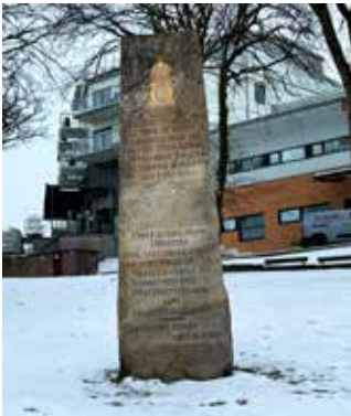
Minnesstenen på Laholmen.

uppgick till 19 döda och 173 sårade och de danska till 96 döda och 246 sårade. Tordenskiöld blev efter förlusten vid Strömstad fråntagen sitt befäl av den danska kungen.