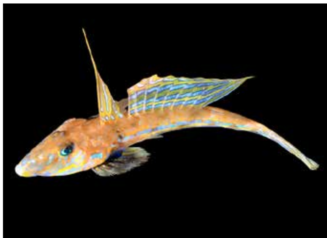
Fisken sjökocks hanner lever farligt med sin sprakande färg men gillas av honan.

När det gäller hannarnas roll, till skillnad från oss människor, så finns det många exempel på att det räcker med en honindivid