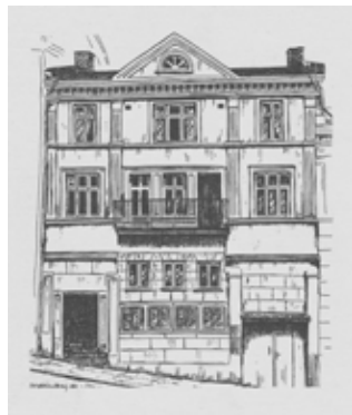
Strömstads Teater 1910. Teckning av Sven-Olle Strandberg.

I början kallades teatern för ”Grand hotells Teater”, men efter några år enbart ”Strömstads Teater”. Teatern låg vägg i vägg med Grand hotell och man