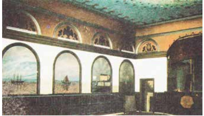
Interiör från teatersalongen. Notera de vackra väggmålningarna.