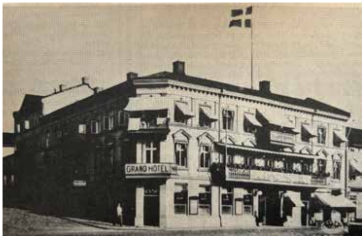
Grand hotell under glansperioden i början av 1900-talet. Teaterbyggnaden syns uppe till vänster, något högre än hotellet.

En stark revytradition hade utvecklats i staden från så kallade ”Muntrationsföreställningar” redan på 1880-talet till glädje för staden och dess gäster