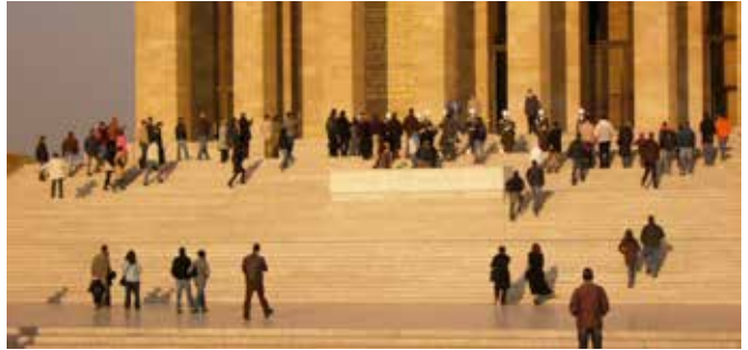
Efter första världskriget stöptes den anatoliska delen av det Osmanska riket om till en turkisk nationalstat. Under Kemal Atatürks ledning tvingades "turkarna" in i en nationalistisk tvångströja. Därav passade inte de kristna armenierna in i mallen, inte heller kurderna.

För att kunna belägga att en "folksjäl" verkligen existerade behövdes vetenskapliga redskap. Tänkare runt om i Europa var rörande överens om att "folken" hade en obruten kontinuitet bakåt i tiden,