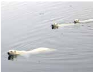
De tre isbjörnarna simmade längs hela båtsidan.

På Svalbard finns det varken träd eller buskar. Men desto fler djurarterer, till exempel knölval, sillval, vitval i stim, valrossar, polarrävar, grönlandsrenar (som gått över isen). Många olika fågelarter, stormfågel, lunnefågel, tobisgrissla, ismås, tretåig mås, silvertärna med flera.