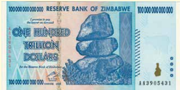
Världens mest värdelösa valuta efter inflation på flera tusen procent, Zimbabwe dollar.