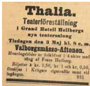
Annons i tidningen Norra Bohuslän den 3 maj 1910.

Källor; Strömstad – så formades staden Strömstadsbygden nr 2 och 5