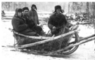
Anonyma fångar i Gulag-läger. Åratalts förvisning till lägren drabbade många svenskar.

Under 1920- och 1930-talen var arbetslösheten och fattigdomen stor i Sverige. En stor grupp familjer med barn och enskilda, många med kommunistisk övertygelse, tog då chansen att få ett bättre liv. I flera fall fick de kommunalt bidrag för att bekosta den långa resan österut. Svenskarna hamnade i olika verksamheter: kolgruvor, väg- och kanalbyggen, kalkbrott med mera.