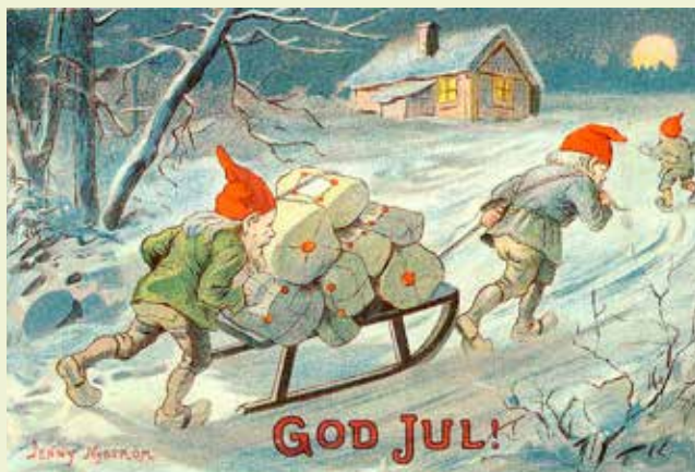
Strömstads Historieförenings styrelse önskar läsarna en riktigt God Jul med denna bild av Jenny Nyström (1854-1946). Nyström var en ikonisk illustratör av olika julbilder.

Vi närmar oss julfirandet och då passar vi på att söka rötterna till ordet ”Jul”, som har en mycket lång historia i de nordiska språken. Det anses ha ett gotiskt eller urgermanskt ursprung i ordet ”Jehwela” som betyder fest eller högtid. Belägg visar att namnet ”geola” på 700-talet betecknade perioden kring vintersolståndet eller december. I fornisländskan finner vi ordet ”Jól” eller ”Jule”. På isländska heter God Jul fortfarande Gle-oileg Jól. Både Norge och Danmark har ordet Jul och i finskan heter det Joulu. I den förkristna tiden hölls sammankomster i december/januari för att fira solens återkomst efter vintersolståndet. Hedniska och kristna traditioner har således blandats och skapat delar av dagens traditionella julfirande. Enligt isländska sagor firade vikingarna Jól och drack öl och mjöd till gudarnas ära. Fläsk och kött ansågs viktigt, vi påminns om grisen Särimmer som återuppstod varje dag hos asagudarna