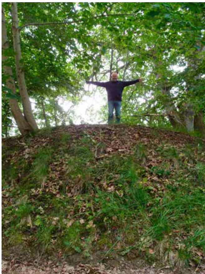
En av flera storhögar i Vettland, Skee socken.

Livet i norra Bohuslän under järnålder avspeglas också i en rad så kallade fornborgar. Dessa har troligen använts som tillflyktsplats under orostid, men kan även ha fungerat som mötesplats. Några forskare vill göra gällande att de haft en funktion inom kult och religion. Eftersom ytterst få fornborgar är utgrävda, och de som undersökts varit påfallande fyndfattiga, är det svårt att med bestämdhet avgöra vad de använts till. På det branta berget mellan ICA Kvantum och järnvägen i Strömstad ligger en vacker fornborg. Från krönet har man en vid utsikt över havet. Inte att förglömma var havsnivån under järnåldern något högre än idag, men ändå var det ett landskap som