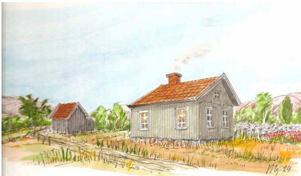
Torpet på Mon.