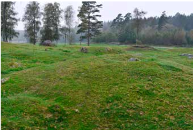
Järnålders gravfältet vid Massleberg.

Vid den tiden fanns varken ett Norge eller Sverige. Stormän och småkungar styrde och ställde över ganska små geografiska områden. Det vi kallar ”politiska gränser” existerade inte. Den styrande eliten band grupper till sig genom vängävor eller ingifte i varandras släkter. Maktpolitiskt och kulturellt stod norra Bohuslän Oslofjordsområdet närmare än Svealand och Götaland. Monumentala gravar vittnar om att området haft sin egna mäktiga familjer. När människor därifrån gav sig ut på handels- eller plundringståg kan vi anta att de gick i västerled, till England, Skottland, Nordsjööarna och Irland.