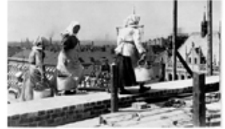
Bilden visar så kallade mursmäckor, kvinnor ofta från Dalarna som tog tillfälliga jobb på byggen i Stockholm under 1800-talet.

Exempel på årets seminarier är: Kirunasvenskarna i Stalins terror, Ull i förhistorisk tid, Språkens rötter, Jihadisternas krig mot kulturen,