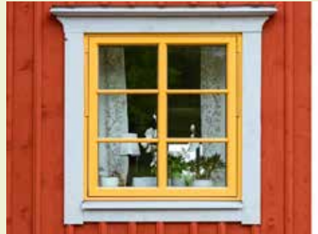
Ett vackert gammalt fönster.

Glas kan uppstå spontant genom kraftig upphettning av kvartssand, t ex genom blixtnedslag eller mycket kraftig brand. Redan för 6 000 år sedan framställdes glas i Persien och Egypten, men då främst som en slags glasyr och små pärlor. De äldsta fönsterglasen har hittats i Pompeji som begravdes 79 e.Kr. Romarna utvecklade glashantering som långsamt spred sig norrut och nådde Sverige på 1200-talet. Glashyttor började anläggas i bland annat Småland och på många andra ställen.