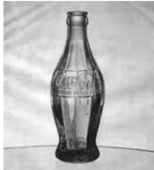
Den första Coca-Cola-flaskan.

Vi kunde bland annat läsa om kungälvssbon som designade Coca-Cola-flaskan.