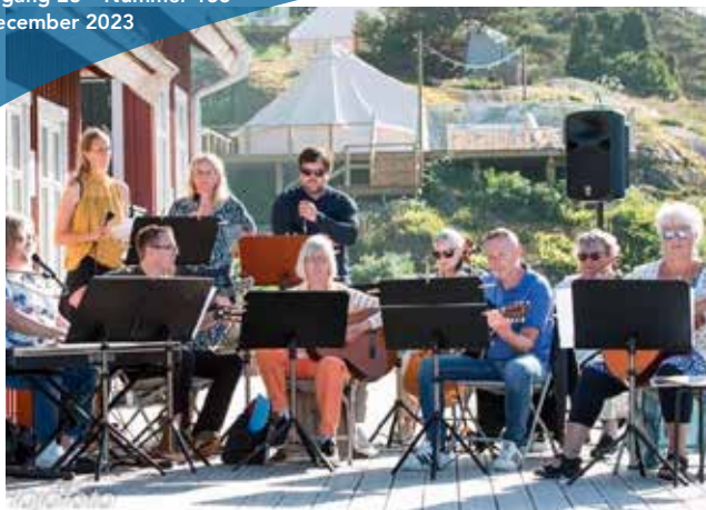
Bild från ett av våra tidigare möten i år med Vuxenorkestern.