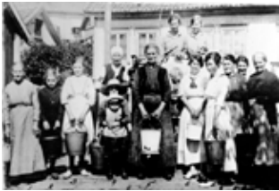
Kvinnor och barn samlade vid en av brunnarna i Strömstad.

till Strömstad och sommartid var det de som i första hand fick dricka brunnsvattnet. Ortsborna fick oftast hålla till godo med sjövattnet.