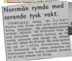
Många tyskar deserterade till Sverige under kriget.

Myteri ombord på tysk båt. Fartyget till Fjällbo.