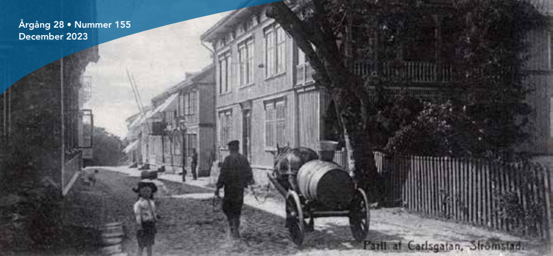
Häst och vagn med vattentunna på Carlsgatan.