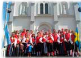
Ättlingarna i Sydamerika håller på svenskheten. Här är de upplädda inför ett midsommarfirande.

Och en värre skulle det bli. När den lilla kolonin ändå hade börjat etablera sig skedde en naturkatastrof i området 1921. Uruguayfloden steg 17 meter efter regn- och stormväder och svenskarna tvingades fly för livet. De tog sig nu över