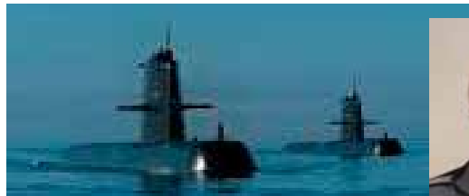
U-båtar är viktiga försvarsvapen.