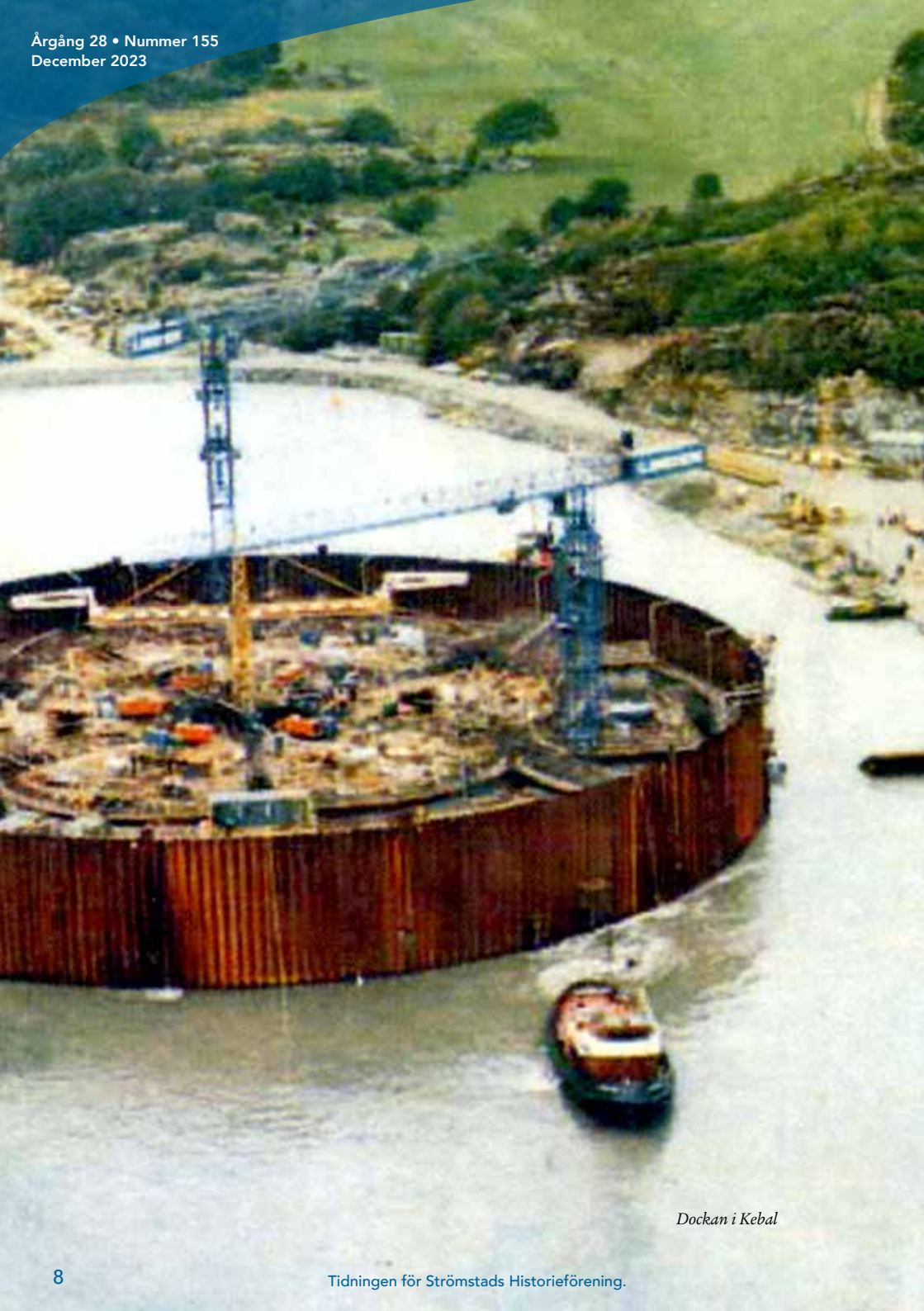
Dockan i Kebab