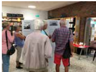
Mycket folk kom till öppningen av utställningen och besökare fortsatte att komma in under hela september.

- Vi hade under månaden många besökare som annars inte brukar besöka