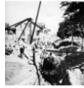
Ledningsarbeten tidigt 1920-tal på nordsidan av staden.