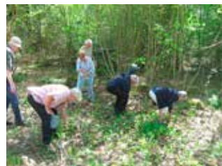
Vid ett snabbstopp med bussen strömmade SHF:are huvudstupa ut och plockade ramslök.