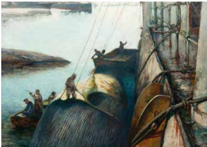
Arbetet på valfångstfartygen gav en bra förtjänst men var både slitigt och farligt. Målning av Carl Dörnberger 1926 på Deception Island, Antarktis.

Till hjälp att få fram berättelser och bilder från valfångsttiden har Valfångstmuseet i Sandefjord hjälpt oss. Vi har letat i litteratur,