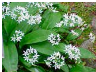
Kinnekulle är känt för sin artrika och unika flora, bl a ramslök.

Nja, nu har också andra källor i närheten pekats ut som dopkälla. Och det finns också de som hävdar att Olof döptes redan tidigare under en vistelse i England. Hur som helst, källan är mytomspunnen och besöks varje år av