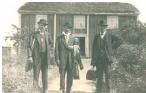
Svenskar inför utvandringen till Amerika.

Den cirkel med släktforskare vi hade under våren 2023 var mycket uppskattad. Därför har vi beslutat att fortsätta med denna cirkel nu i höst. Vi kommer att starta onsdagen den 13 september kl 18.00 på museet. Vi ser gärna att nya