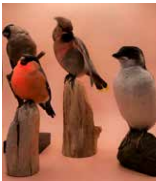
Fågelmodeller var ett inslag i fotocirkelns arbete.

Fotogruppen brukar träffas en gång i månaden. Syftet med gruppen är att i studiecirkelns form bli bättre på att fotografera och ta bättre bilder. Vid varje träff brukar någon i gruppen prata om några fotografiska begrepp.