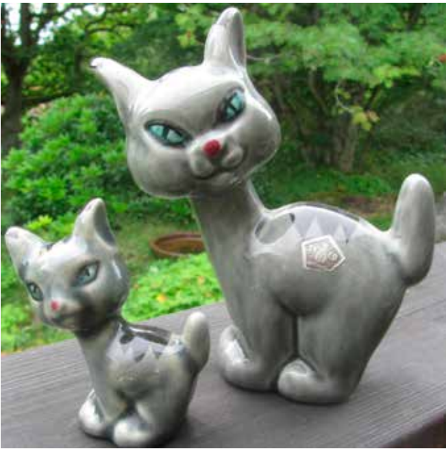
SYCO-katt producerades i flera olika storlekar.