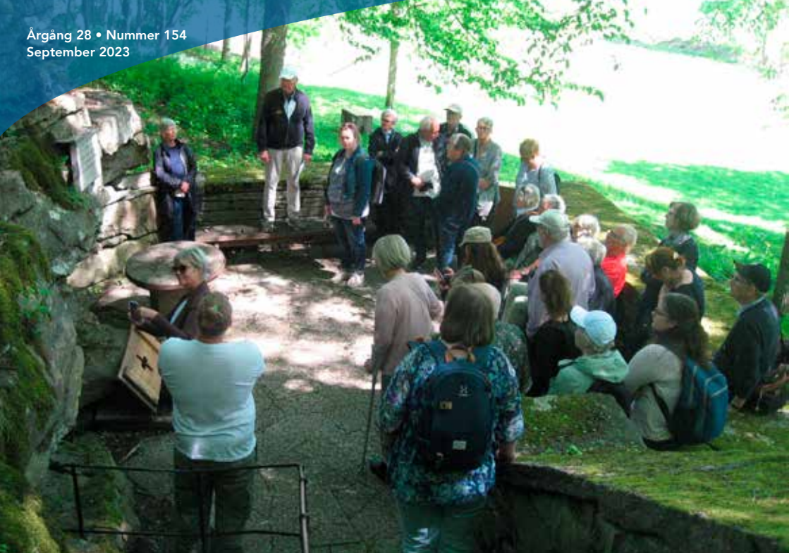
SHF-are vid den mytomspunna källan i Husaby.