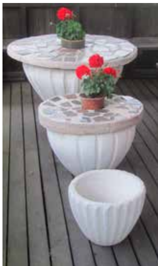
"Krukan som andas" var den första produkten som SYCO lanserade.

Strömstads tidning presenterade den 22 november 1945 nyheten, att en stor keramisk industri skulle etablera sig i staden. Det blev en intensiv tid för SYCO, att finna lokaler, utbilda personal samt att