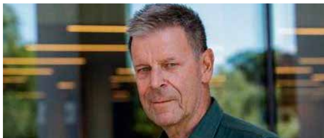
Lars Hansson har gjort en gedigen forskarinsats om flykten till Sverige, Foto: Göteborgs universitet.

av svenska landsfiskaler och där framträder den stora svenska hjälpinsatsen. Men också nazianstrukna svenska tjänstemän med en inhuman syn på flyktingpolitiken.