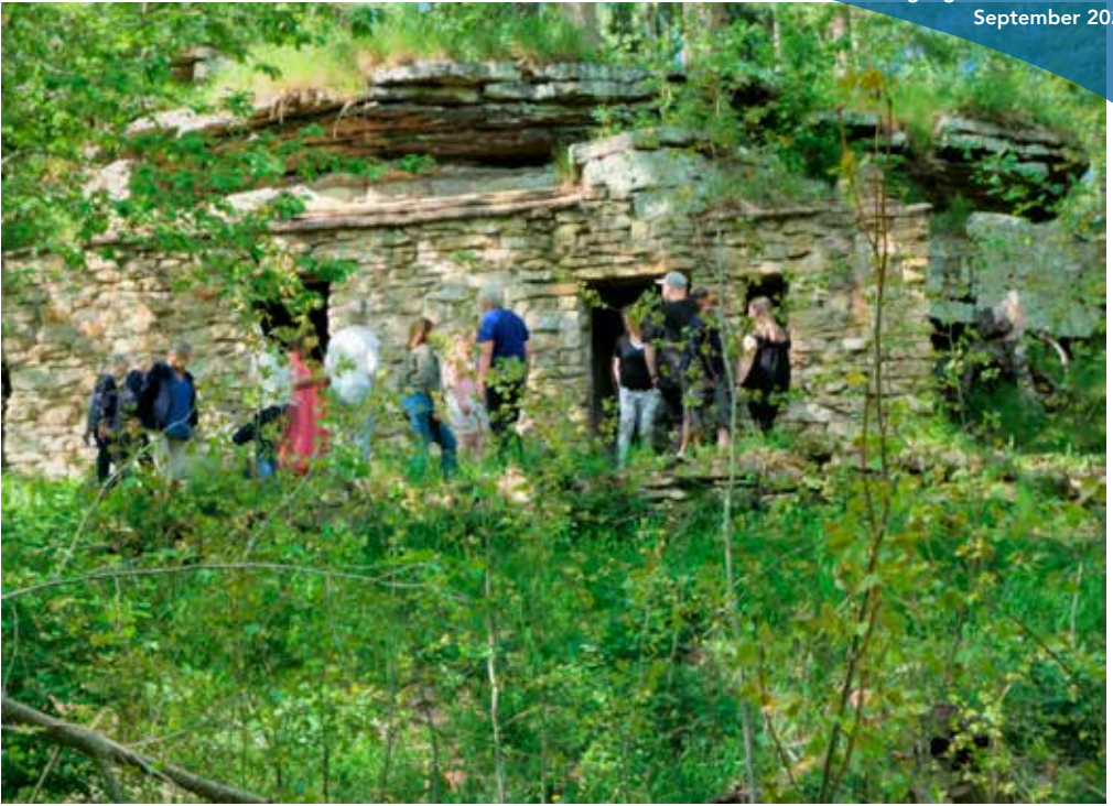
Besök vid "Lasse i bergets" grotta under resan i maj.

mängder med intresserade. Det var klokt att reseledarna Sonia och Håkan hade förbokat lunch på Kinnekullegården högst uppe på toppen för där var sprängfyllt. Nu satt vi i en egen separat del av restaurangen med sin utmärkta mat. En eloge till busschauffören som lyckades trixa in bussen på den överfulla parkeringen.