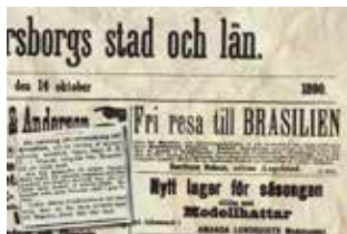
I tidningsannonser utlovades fria resor.