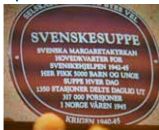
Skylt vid Margareta kyrkan i Oslo som berättar om svensk hjälpen.