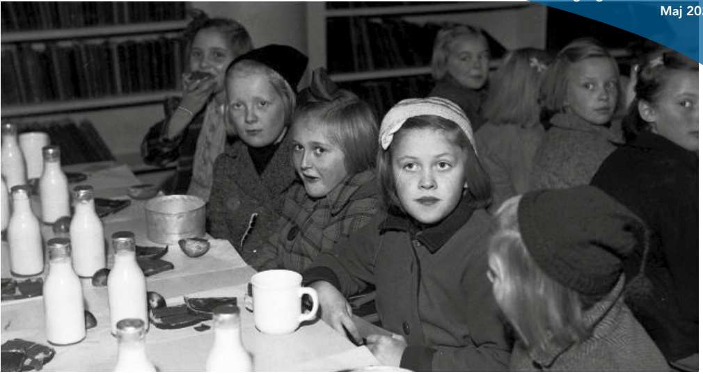
Norska skolbarn när de serverades den dagliga soppan under krigsåren.