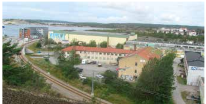
Hit till Myren-området bedrev Original Odhner sin verksamhet som Strömstads största industriföretag.