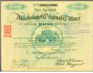
Efter flykten från revolutionen i Ryssland startades det nya aktiebolaget Original Odhner i Göteborg 1918.