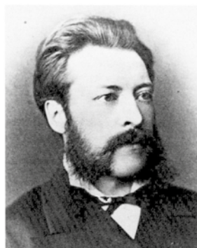
WILLGODT ODHNER

Detta var en av de första räknemaskinerna som Odhner tillverkade i Ryssland (med kyrilliska bokstäver).