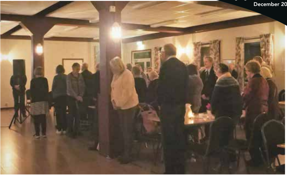
Närmare 80 personer hade mött upp på novembermötet där en tyst minut inledde minnesstunden.