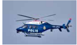
Ett decennium skiljer den här polisutrustningen åt – första polisbilen 1913 T.v. och en modern polisbhelikopter här ovan.

Från andra hälften av 1800-talet formade sig polisväsendet till en mer likformad kår. Det beslutades att uniformeringen skulle vara lika och i huvudsak bestå av skärmössa och en enradig vapenrock. En polisbil, den första i Sverige, levererades 1913 till Göteborg. Den kom från Scania-Vabis och hade samma kaross som hästvagnen Wurst. Bakom föraren fanns bänkar för 8 passa-