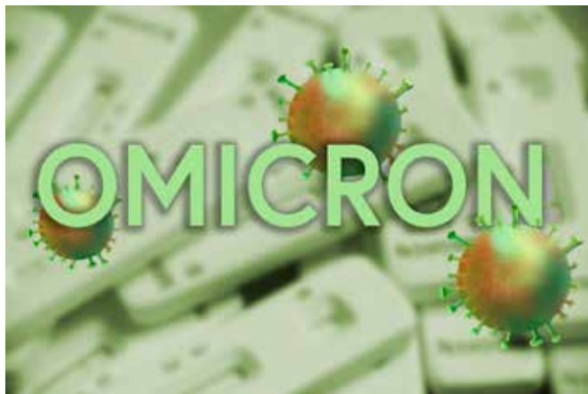
Omicron-viruset har fått en kraftigt ökad spridning i hela världen och osäkerheten om utvecklingen är stor.