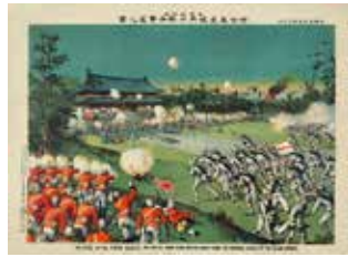
Stormakterna kväste 1901 Boxarupproret med mycket hårda medel och en stor krigsinsats.

Vid ingången av 1800-talet ändrades premisserna för Kina, vars utveckling hade stagnerat i jämförelse med Europa och överklassnöjet att röka opium hade spritt sig till ett missbruk i alla samhällsklasser. Bruket av opium fick utöver omfattande sociala konsekvenser en förödande påverkan på Kinas handelsbalans. Vinsterna av den illegala opiumhandeln var gigantiska för brittiska Ostindiska kompaniet och den redan