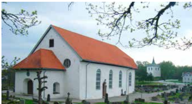
Skee kyrka, med anor från 1100-talet, var en av de många kristna byggnader som blev svensk egendom efter freden i Roskilde.