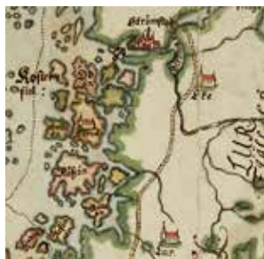
Karta där den gamla Kungsvägen är inritad bl a förbi Lur och Skee.

Vägen följer i stort sett den gamla E6:an (eller Riks 2-an) genom Bohuslän. Här lär Sigurd Jorslafar – Jerusalemfararen – ha ridit år 1116. Och Karl XII for