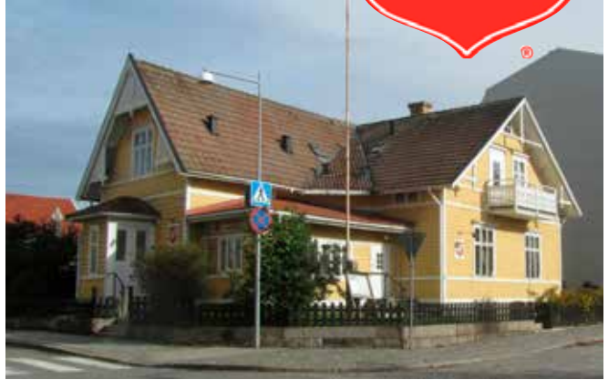
Kårens samlingslokal i Strömstad.