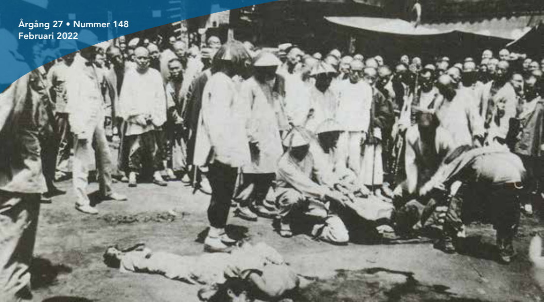
Den folkliga resningen "Boxarupproret" i Kina ledde till tusentals dödsoffer, bl a svenska missionärer.

genom att göra sammankomsten till ett privat möte.