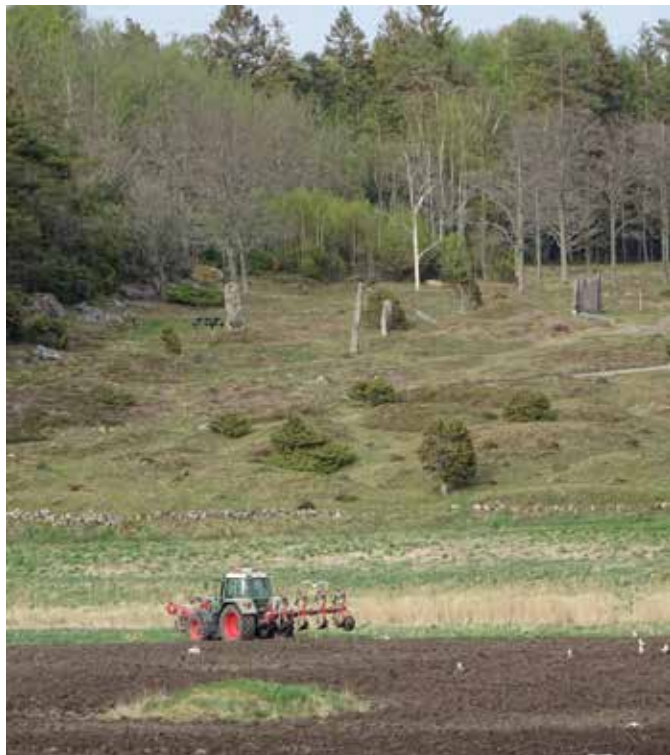
När den förmodade stora hantverks- och handelsplatsen var igång, i utkanten av dagens Grebbestad, stod havet mycket högre än idag. Där det nu är åkermark, och där traktorn står, gick det då att lägga till med båt.

I motsats till andra områden är det här väl förspänt med tidiga historiska urkunder. Till exempel skriver