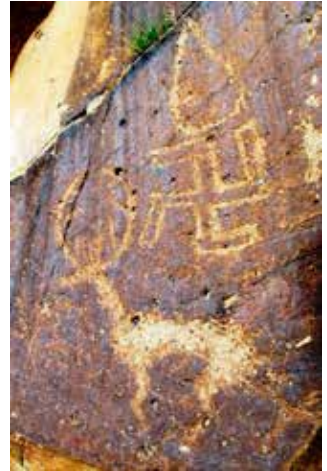
En uråldrig hjortkult i Sibirien använde svastikan som symbol för solens vandring på denna ristning.

Just hällristningarna i Bohuslän blev föremål för nazisternas intresse. Flera SS-expeditioner sändes på 1930-talet från Tyskland för att göra avgjutningar av hällristningar. Bl a planerades en avgjutning av en svastika som födelsedagspresent till Adolf Hitler.