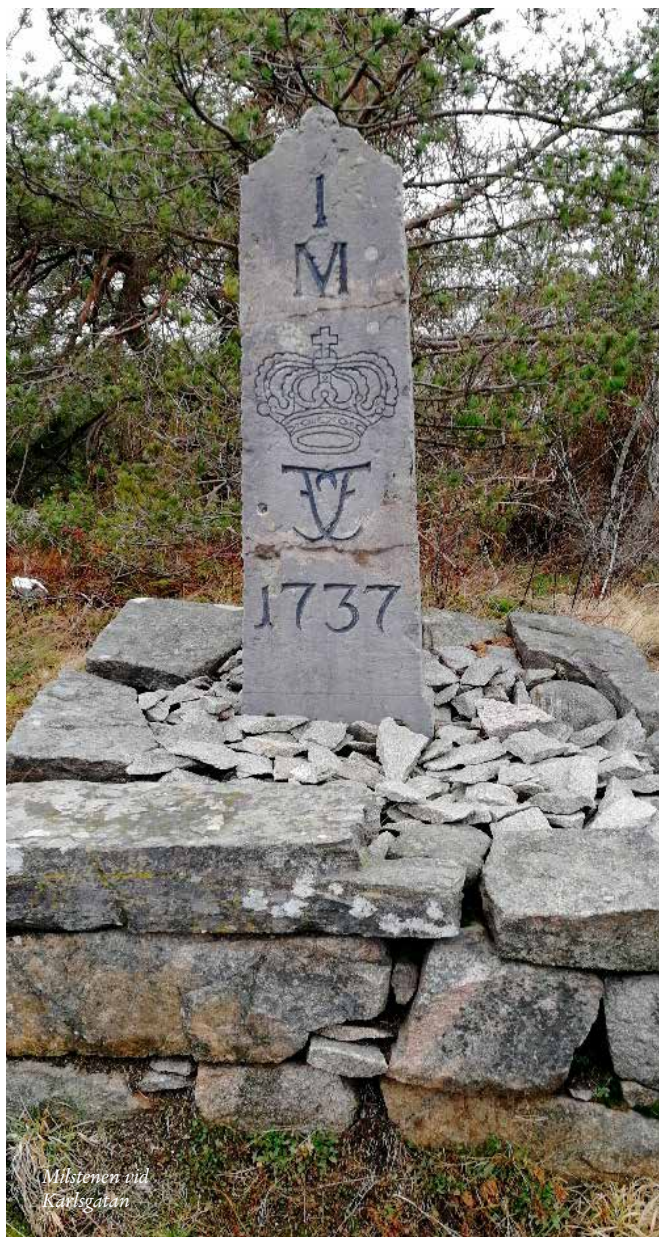
Milstenen vid Karlsgatan

I och med detta blev samfärdseln och förbindelserna enklare. Vägsträckor mättes upp och skyltar i form av stenar med angivande av sträckor placerades ut. Stenarna hade olika form och inskriptioner beroende av hur tätt de stod. De angavs i sträckorna "kvartermil" "halvmil" och mil". En svensk mil var då ca 18000 alnar vilket i dagens läge motsvarar ca 10 700 meter. Att sträckorna blev olika långa är kanske inte så svårt att förstå. Man mätte backe upp och backe ner, genade i kurvorna och sträckte säkerligen inte alltid ut snöret.