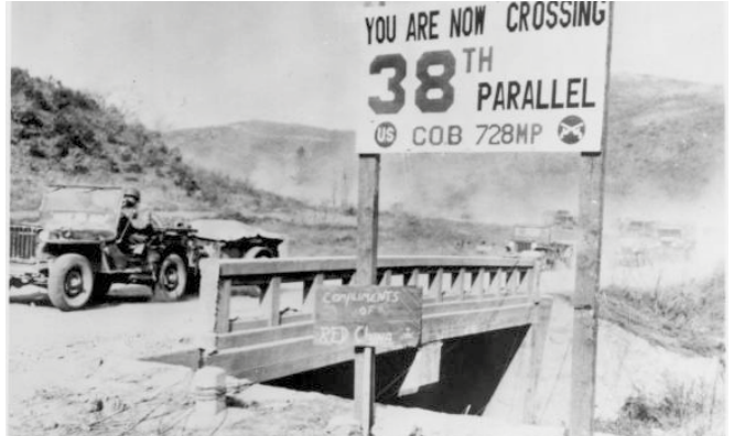
Den 38:e breddgraden delar den koreanska halvön och dess befolkning.

Mitt i detta är Sverige det enda landet i världen som har officiell närvaro i både Pyongyang, i Seoul och i ingenmanslandet mellan de två Korea, den s.k. demar-