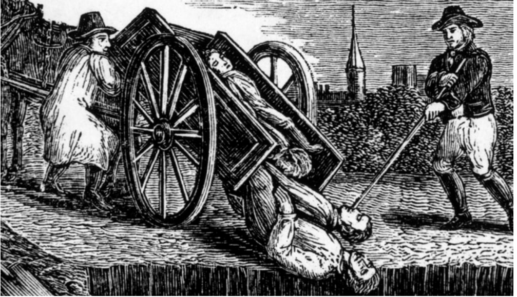
En medeltida kopparstick visar hur offer från Digerdöden begravs i massgrav.