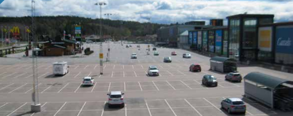
Nordby parkering en vardag i maj 2020. En talande bild hur hårt coronakrisen har slagit inte bara på handeln utan hela vårt samhälle.