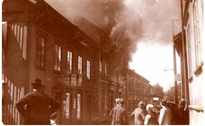
Det var här i det Riberska huset branden började.

Det brann för fullt i det Riberska huset. Men värre skulle det bli, mycket värre. Den ljuvliga västanvinden, den som var så härlig att segla i, den satte fart på elden. Det dröjde inte länge förrän elden kastat sig över gatan till husen på andra sidan. Den svepte sedan fram längs hela Karlsgatan och spred sig även in i grannhuset där Emelie Flygare-Carléns föddes och vidare mot det gamla apoteks-