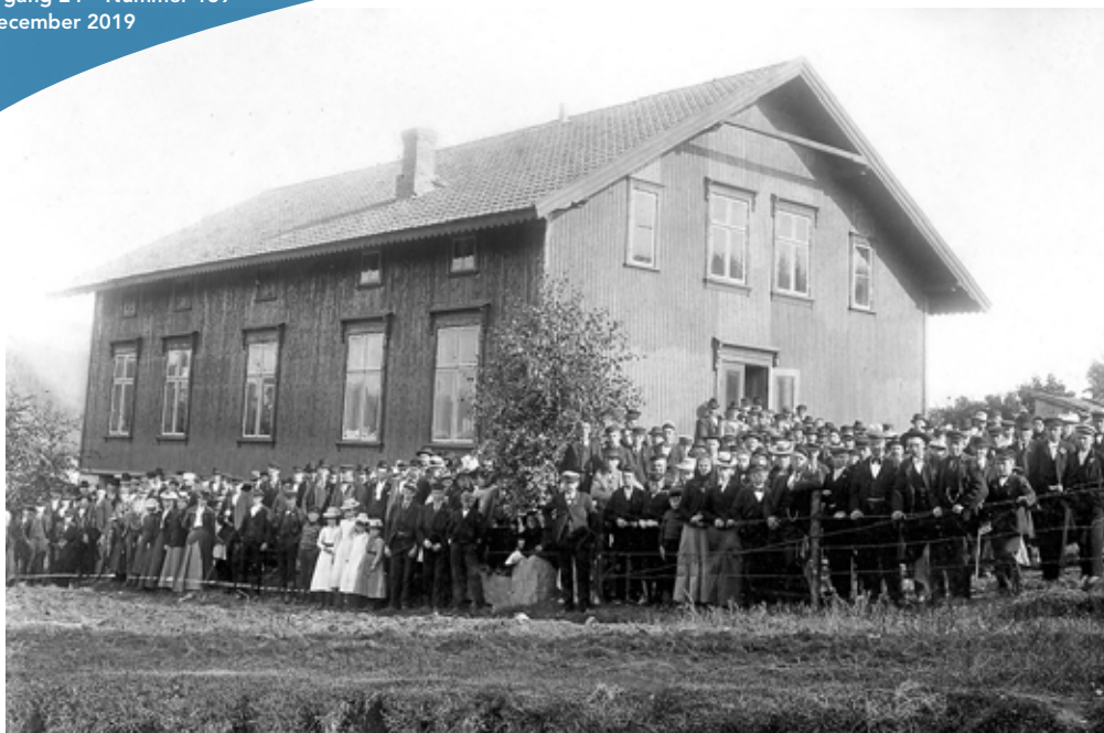
Inviqning Folkets Hus i Krokstrand 1902, Bobusläns äldsta. Bygget gick i rekordfart med start i maj och färdigt i september.

Att driva en verksamhet av denna art kostar naturligtvis pengar och det var det inte gott om. En typ av inkomstkälla var att anordna fester och ha uthyrning av huset till olika arrangemang. Efter ett tag fick man dock bidrag av statliga nämnden för samlingslokaler. Inkomst genom filmvisningar fick man tidigt.