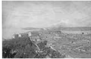
Katastrofbranden i Strömstad 1876 som ödelade stora delar av staden, däribland societetshuset. Men i rekordfart restes ett nytt hus ur ruinerna som nu är Kulturhuset Skagerack.

Strömstad hade på 1800-talet utvecklats till en av Sveriges mest berömda kur- och badorter. Tidigt fanns ett societetshus, ungefär