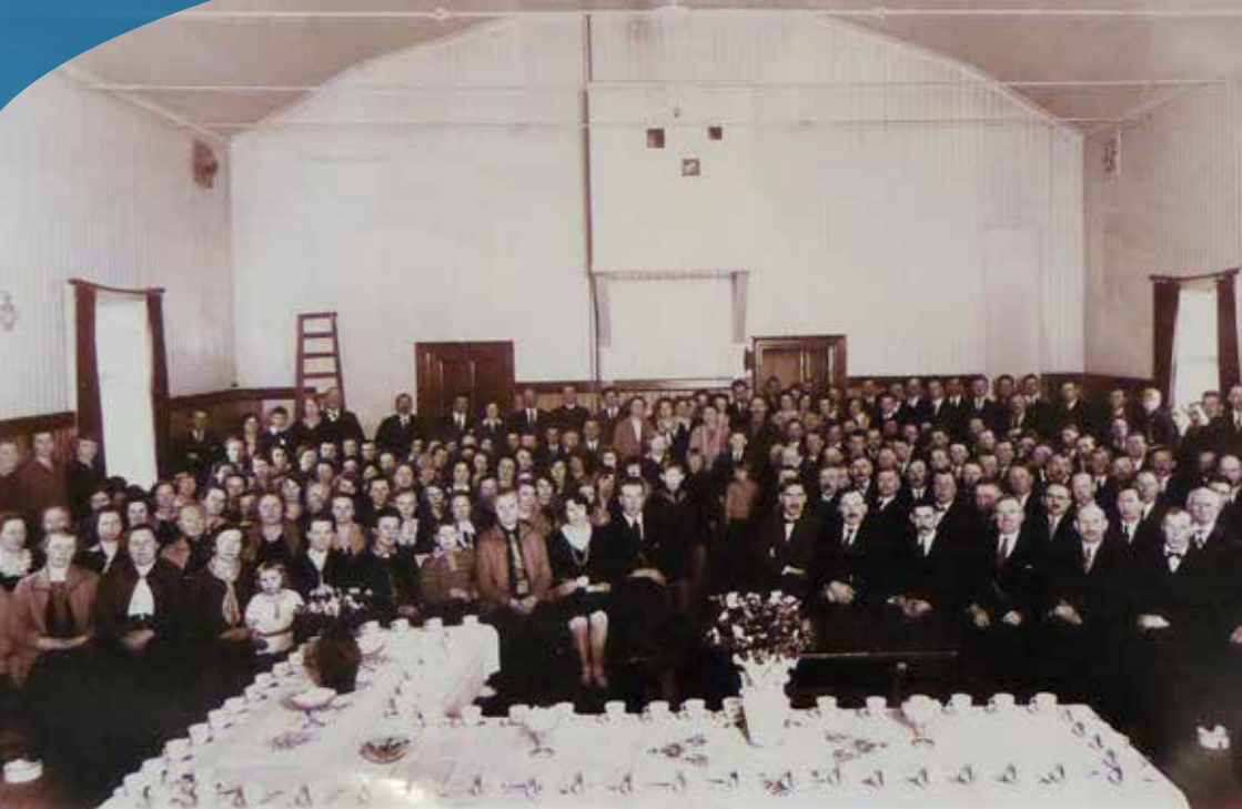
Konsumföreningens möte i Folkets hus 1931. Noterbart är att i salen fanns 24 spottkoppar, några syns längst ned t.v och t.h.