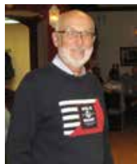
T.v. Oljemålning över slaget i Dynekilen. från Marinmuseet, Horten Ovan: Nils Modig