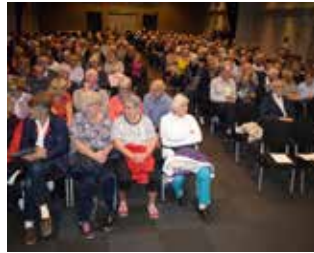
350 personer personer kom för att lyssna på Herman Lindqvist på Strömstad Spa

Vasaättens framväxt präglades enligt Lindqvist annars av våld och girighet. Man gifte sig rikt, samlade stora jordegendomar och plundrade kyrkor.