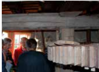
Inne i kvarnen ser man de mäktiga kvarnhjulen med sina kuggar.

Under ledning av Tanums kommun och hembygds-