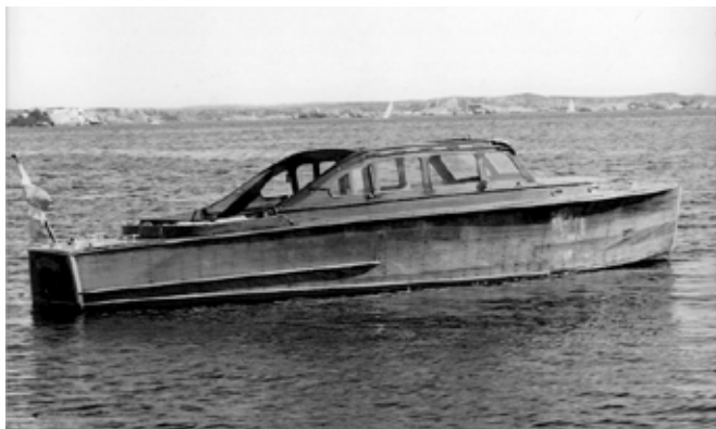
Det var snabba, lätta båtar – s.k. spritracers, liknande denna båt, som användes av smugglarna.