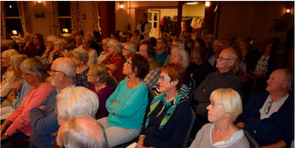
Föredraget om Elvira Madigan, Sixten Sparre och hans hustru Luitgard fånglade SHF-publiken, som inledningsvis fick friska upp minnet genom att sjunga skillingtrycket om dramat.

visade en skuldsättning upp över öronen. Han hade också spenderat hustruns stora hemgift, hon kom från en lägre rankad men välsituerad adelsfamilj, och de pengar morfadern satt in på de båda barnens konton. I polisutredningen efter det att Sixten först skjutit Elvira och sedan sig själv redovisas bland deras packning. Hon hade tagit med sig alla ägodelar, han bara ett fåtal klädesplagg - och sin pistol. -En reste för att börja ett nytt liv, den andre hade kanske en annan avsikt, sa Lindhe.