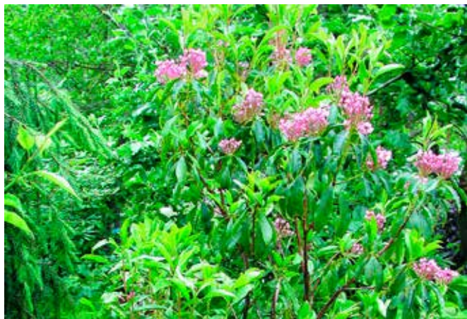
Bredbladig kalmia – Kalmia latifolia – är Pennsylvanias delstatsblomma och har fått sitt namn efter Kalms resor i Nordamerika.