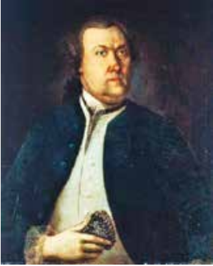
Pehr Kalm (1716-1779) var en av Linnés främsta adepter och sändes ut i många botaniska resor. Men han var dessutom präst och professor i ekonomi.