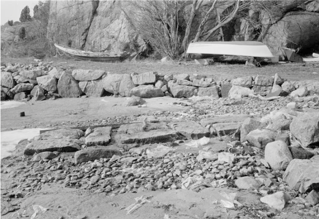
I närheten av det gamla båtvarvet på Hällekind låg det statliga projektet om saltutvinning

Verksamheten fick bra fart i början. Åren 1667-69 uppgick saltproduktionen till drygt 1.400 tunnor.