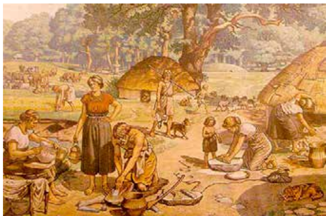
Livet i en bronsåldersby med bl a matlagning. Motiv från skolplansch.

Mesopotamien i nuvarande Irak brukar räknas som civilisationens vagg. Där lärde man sig redan för mer än 10 000 år sedan att förädla och odla spannmål och den gröt som då kunde lagas fick ett högt