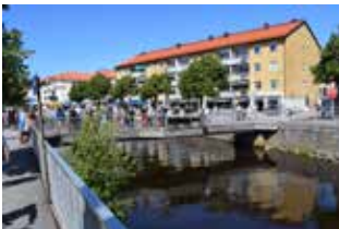
Bron i höjd med bokhandeln.

Nu lyfts hon fram som mor till poeten och visdiktaren Evert Taube.