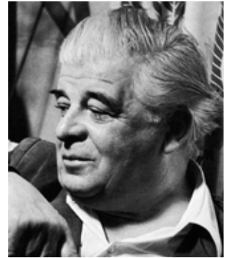
Evert Taube gillade sin barndoms gröt med sirapsvatten.

Evert Taube är en av många som skildrat grötmåltiden. I ”Västlig horisont” skriver han: