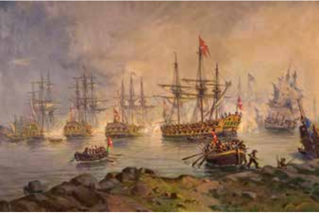
Slaget vid Dynekilen 1716 är ett av de ämnen eleverna tar upp i Storyspot. Målning Paul Sinding, Horten Marinmuseum.