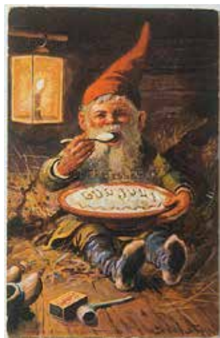
Tomten och julgröt var ett kärt tema för Jenny Nyström på många julkort.

Andra exempel på gröten språkliga inflytande är talesätten "att vara het på gröten" och "gå som katten kring het gröt" eller det föga smickrande att "någon var grötmyndig"