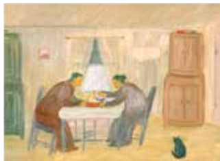
I århundraden har gröten varit basfödan i svenska bondesambället. Tavla av C.B Bernadsson "Grötätarna".