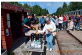
Sista matuppehållet innan ankomst till slutstationen i Mora.

När nu landskapet ser ut som det gör behövs det många broar, drygt 250 stycken. Två av dessa broar är kombinationer med biltrafiken. Lokföraren får här stanna tåget, gå ut och fälla bommarna för biltrafiken och sedan själv köra över. De aktuella broarna är Mankellbron över Ljusnan och Piteälvbron över Hundforsen i Lappland. I Sverige finns ytterligare 4 broar av denna typ. Modernisering genom övergång till elektrifiering påbörjades år 2010.