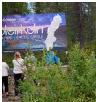
Här passeras Polcirkeln strax söder om Jokkmokk, markerad med vita stenar.

Turistnäringen är numera företagets största kund. Specialresor med olika inriktningar finns att boka beroende på intresse. Valborgståget startar i Gävle och slutar i Gällivare där Valborg firas på Dundrets topp. En resa där man bor ombord på tåget. Tågfluff-