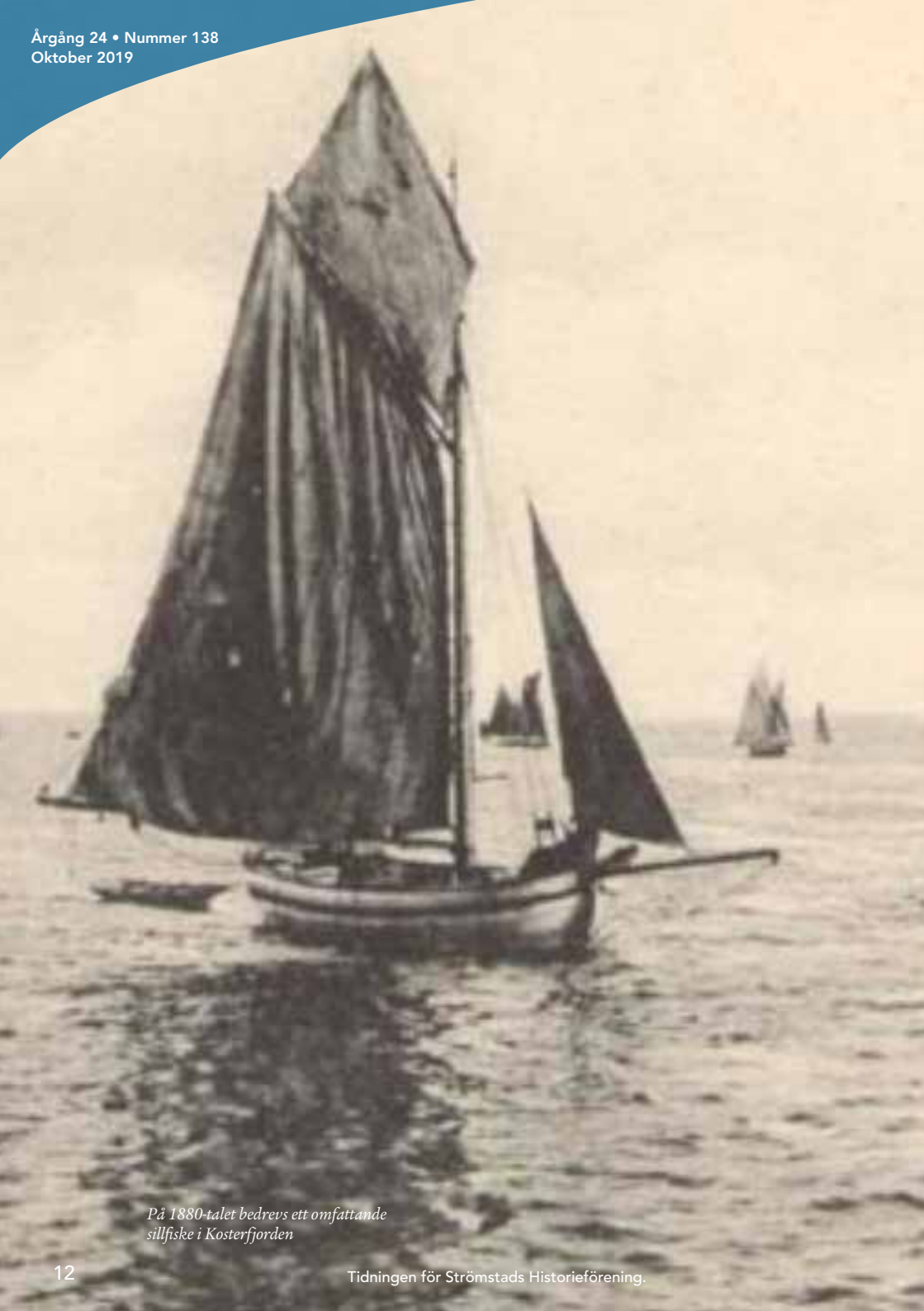
På 1880-talet bedrevs ett omfattande sillfiske i Kosterfjorden