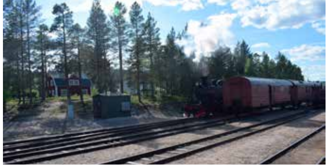
På vissa turer används fortfarande ånglok.

Regeringen fattade år 1907 beslut om att bygga den första delen av banan. Den delen var klar 1912 och beslut om att fortsätta utbyggnaden var taget 1911. Utbyggandet av banan skedde så i etapper och var klar 1937. 1917 och 1918 köpte staten in de privata sträckningar som hade börjat byggas och trafikeras redan år 1857. Sedan 1850 fram till 1857 hade trafiken drivits med hästkrafter.