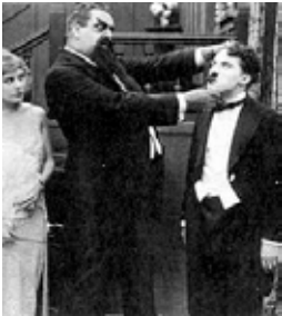
Eric Campbell och Charlie Chaplin