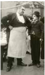
Eric Campbell och Charlie Chaplin

Torsdag 17 okt. Eric Campbell (1879-1917) var en brittisk stumfilmsskådespelare. Känd som Charlie Chaplins storväxte antagonist, bl a i filmen "Lugna gatan."