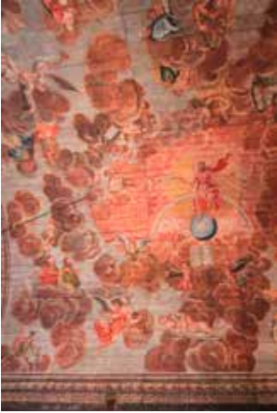
Naverstads kyrka rymmer en mycket imponerande samling takmålningar.

ningar. En triumfbåge som en gång rivits, byggdes upp igen på 1920-talet medan det innertak som sattes upp runt 1890 också togs ned i samband med restaureringen. Därvid framträdde åter de vackra takmålningarna som gjorts av kyrkomålaren Christian von Schönfeldt år 1731.