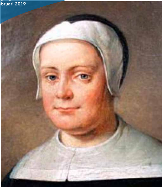
Margaretha Hvitfeldt var en genom tiderna Bohusläns mäktigaste kvinna.