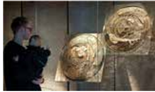
Västergötlands Museum i Skara

Vid utgrävningar på höjden bakom klosterruinen i Varnhem har arkeologerna gjort sensationella fynd som berättar om platsen från tiden innan munkarna kom dit på 1100-talet. Här finns ruinen av en av Sveriges äldsta kyrkor, en privat gårdskyrka från vikingatiden. Kyrkans krypta är kanske Sveriges äldsta bevarade rum! Här finns också en kristen gravplats som började användas redan på 900-talet – sensationellt tidiga dateringar! Runt omkring ligger de äldre gravhögarna från järnå-