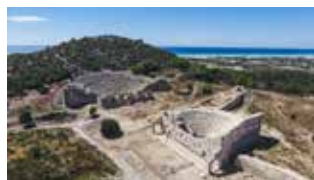
Amfiteatrar är bland de många lämningarna i Turkiet.