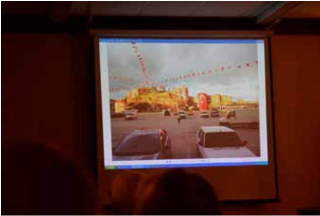
Turkiets flagga syntes över allt men inte alltid på flaggstång.

i cirka 3 timmar. Det var ett känt svenskt bussfabrikat, men en tydligt bättre standard än de som rullar i Sverige. En bekväm resa tog dem upp på ungefär 1200 meter över havet.