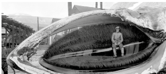
En av de landade blåvalarna som skall styckas för vidare hantering.