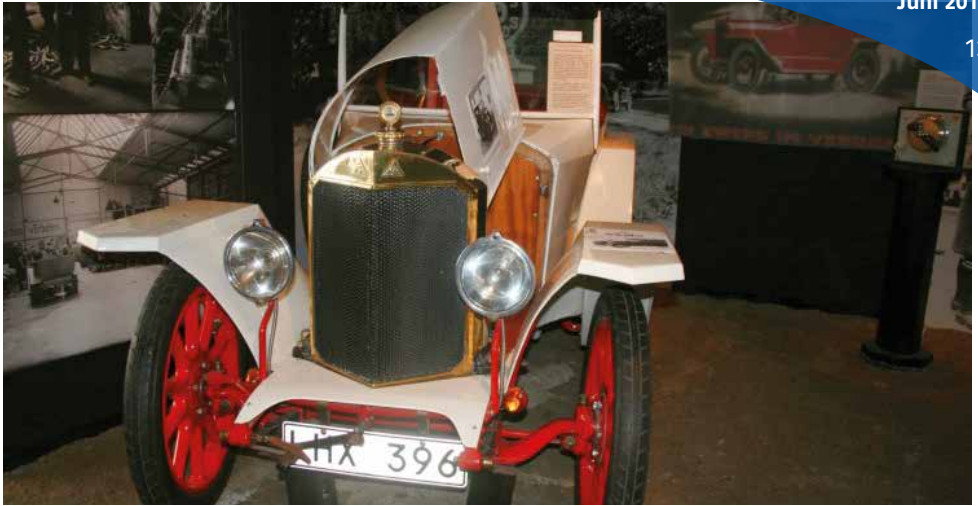
AGA-Bilen från 1920 är en av det ytterst få exemplaren som finns kvar.

På Gustav Dalén museet i Stenstorp tog vi ett raskt steg in i mer modern tid. Dalén föddes i Stenstorp 1869 och var en makalös iderik uppfinnare. Mest känd är han förmodligen för Agafyrarna, tex solventilen som tänds och släcks med hjälp av ljuset från solen. Under hans tid som VD utvecklades Aga till ett världsledande företag. Han blev blind i samband med en gasexplosion men fortsatte ändå sitt metodiska arbete med olika innovationer. 1912 fick han nobelpriset i fysik.