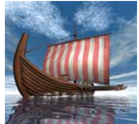
På vikingatiden var det segelbar farled ända till Skee

Studierna skall leda fram till praktiska besök på platser i främst Skee, som är välkänt för sina många fornlämningar. Bl a kommer man att behandla hur Skee såg ut under vikingatiden då farleden gick långt