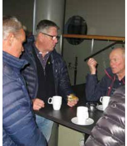
Mingel kring kaffebordet.

tänkt för eko-brott. Starka misstankar finns om att Putin är inblandad i beslutet. Han hade dock inflytande när Chodorkovski släpptes ur fångenskapen år 2012.