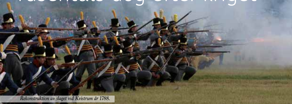
Rekonstruktion av slaget vid Kvistrum år 1788.

Få soldater stupade i det halvtimmeslånga slaget vid Kvistrum 1788 men tusentals soldatliv gick till spillo, efter kriget. "Tyttebärkriget" var ämnet för Torbjörn Segelods föredrag på oktobermötet.