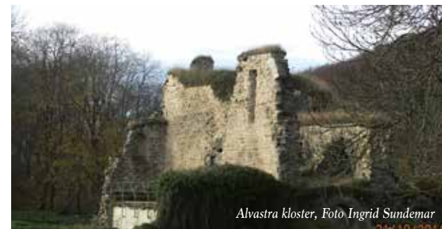
Alvastra kloster

Följer man den lilla vägen vidare kommer man fram till Ellen Keys Strand, där hon skapat sig ett hem vid strandkanten. Strand är idag ett museum till minne av henne, som banérförare för arbetarrörelsen och den tidiga feminismen.