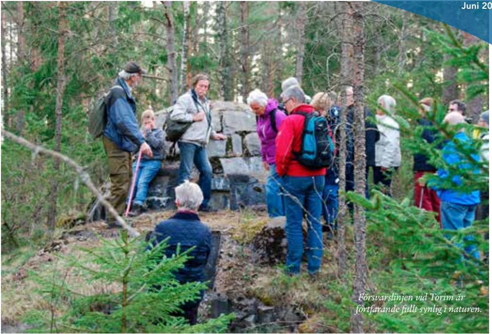
Försvarslinjen vid Torim är fortfarande fullt synlig i naturen.