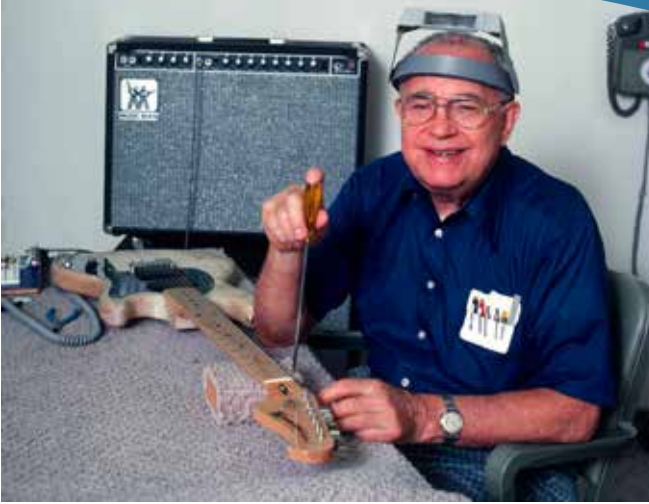
Leo Fender var en elektronisk naturbegåvning. Han skapade världens mest berömda gitarr.

1938 lånade han 600$ och startade sin egna verkstad. Han började konstruera och tillverka högtalaranläggningar och förstärkare. Han började anlitas av musiker och hans goda rykte spred sig. Han började också att intressera sig för gitarrer och insåg att den stora klanglådan inte behövdes, utan en träplanka med mikrofon och en förstärkare räckte för att gitarristen skulle höras i dom stora orkestrarna. "Elplankan" var uppfunnen. Hans första gitarrmodell kom 1948 och kallades Broadcaster, vilken senare modifierades under modellbeteckningen Telecaster (med två mikrofoner). Fender konstruerade